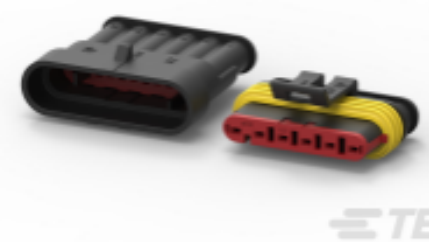
TE 产品编号CAT-AM71-CH8172 AMP SUPERSEAL 1.5MM, 连接器壳体