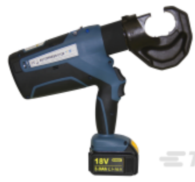
TE 产品编号 2107733-4 AUTOPRESS C120 18V+COF+CHARG 110V