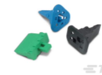
TE 产品编号CAT-D487-W416 Wedgelocks: DEUTSCH DT