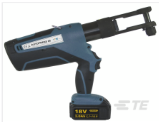
TE 产品编号 2107730-1 AutoPress 80 18V+COF+CHARG