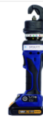
TE 产品编号 2107475-2 UNIPRESS 6/120 +COF+CHARG