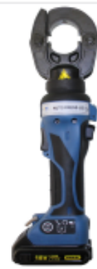
TE 产品编号 2107725-1 AUTOPRESS L62+ COF+CHARG 110V