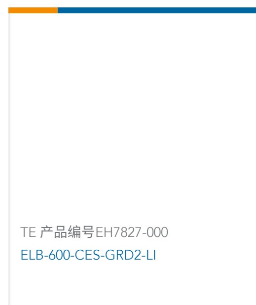
TE 产品编号EH7827-000 ELB-600-CES-GRD2-LI