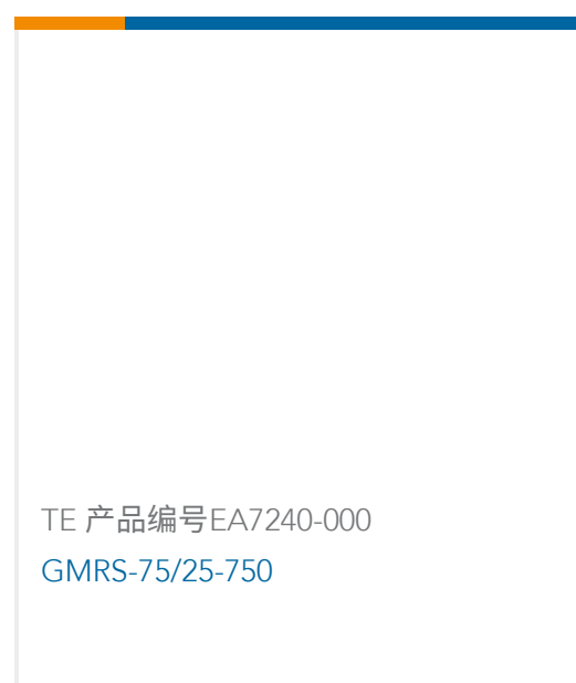
TE 产品编号EA7240-000 GMRS-75/25-750