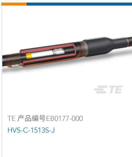
TE 产品编号EB0177-000 HVS-C-1513S-J