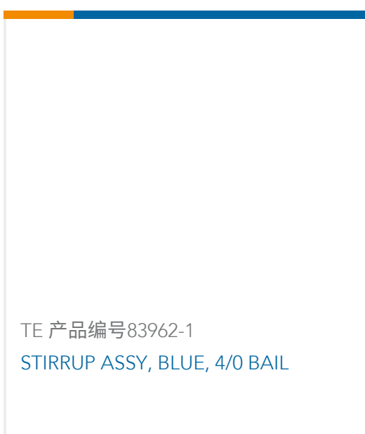
TE 产品编号83962-1 STIRRUP ASSY, BLUE, 4/0 BAIL