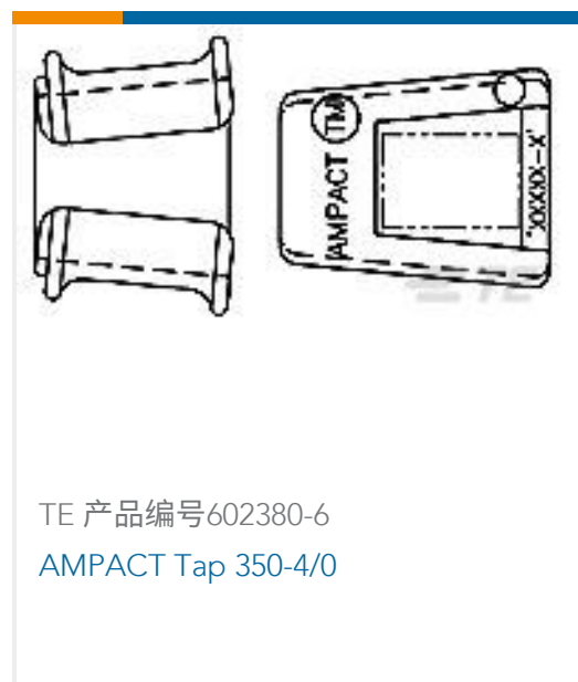
TE 产品编号602380-6 AMPACT Tap 350-4/0