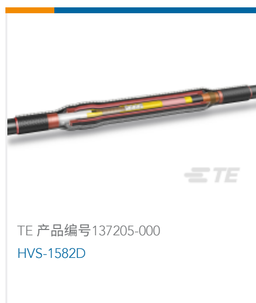
TE 产品编号137205-000 HVS-1582D