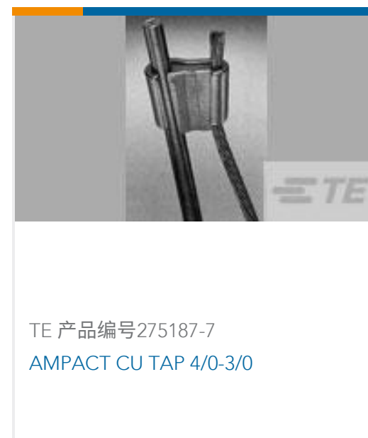
TE 产品编号275187-7 AMPACT CU TAP 4/0-3/0