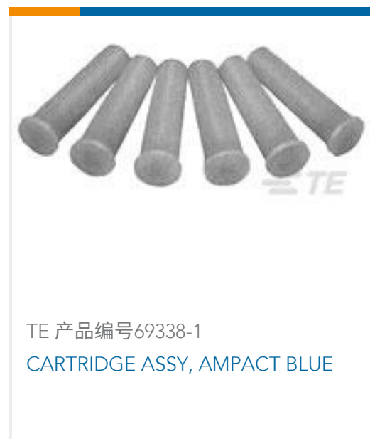
TE 产品编号69338-1 CARTRIDGE ASSY, AMPACT BLUE