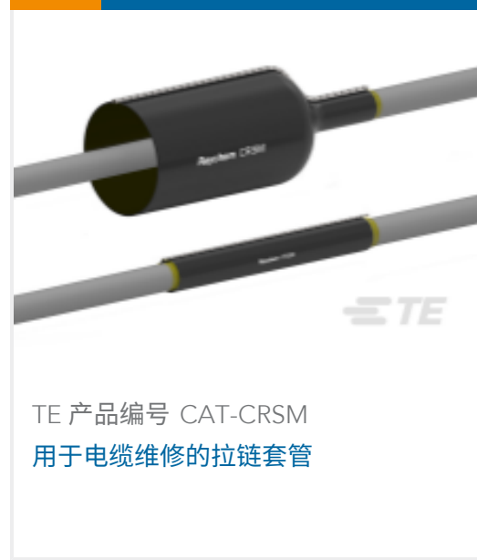
TE 产品编号 CAT-CRSM 用于电缆维修的拉链套管