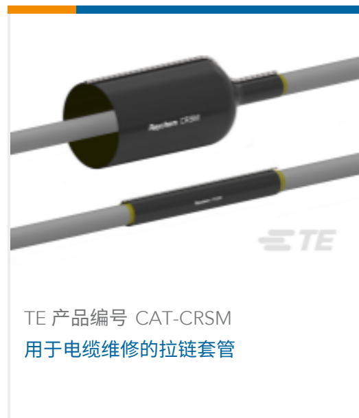
TE 产品编号 CAT-CRSM 用于电缆维修的拉链套管