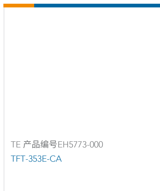
TE 产品编号EH5773-000 TFT-353E-CA