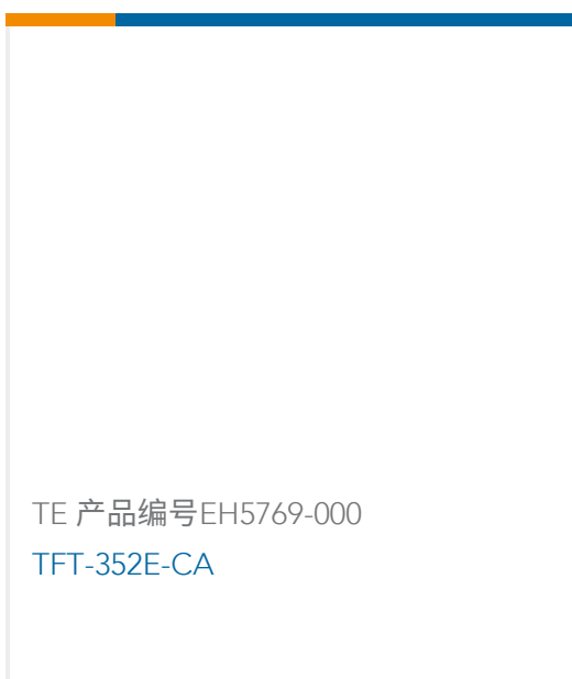
TE 产品编号EH5769-000 TFT-352E-CA