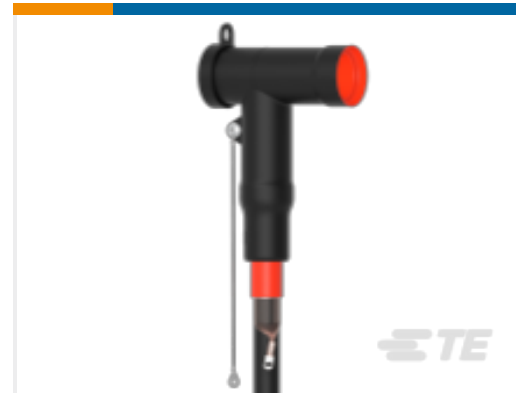
TE 产品编号CR4949-011 屏蔽式可分离连接器 1250 A