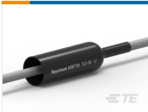
TE 产品编号562513-000 中厚壁热缩管