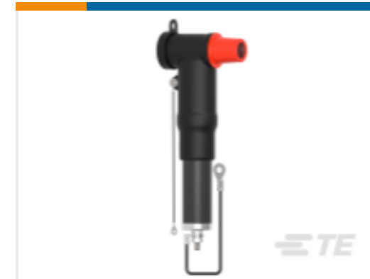
TE 产品编号CS3036-000 RSTI-CC-68SA3610