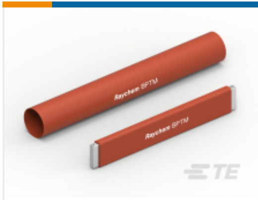
TE 产品编号412147-000 BPTM-120/50-A/U-4(S25)