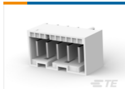
TE 产品编号2232532-5 5P, PL RAST 5 Tab Header, TH,Vertical