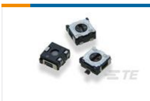
TE 产品编号1623905-4 3315X 10K