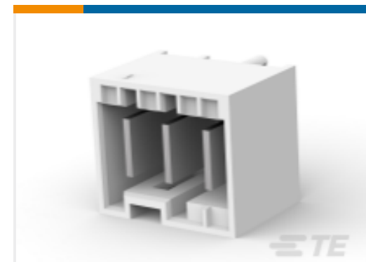
TE 产品编号6-2232532-3 3P, PL RAST 5 Tab Header, TH,Vertical