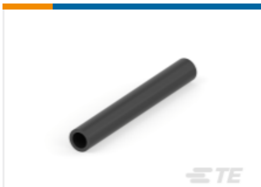
TE 产品编号C77960-000 Versafit-V2 Heat Shrink Tubing