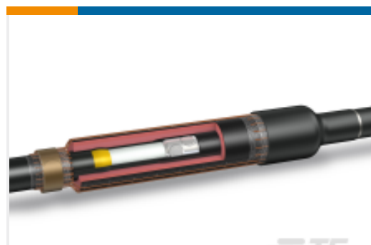
TE 产品编号E67139-069 POLJ-24/1X120-240