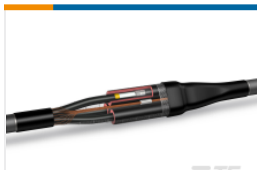
TE 产品编号D11309-070 POLJ-12/3X25-70