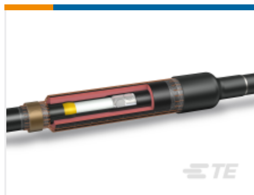
TE 产品编号E67139-069 POLJ-24/1X120-240