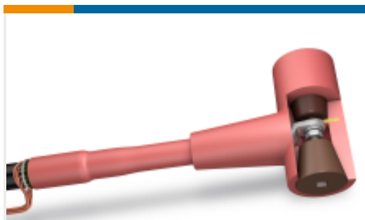
TE 产品编号555340-070 RICS-5123