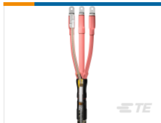
TE 产品编号A31452-070 GUST-12/70-120/800-L12