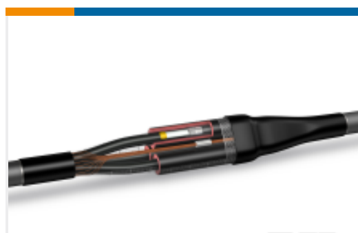
TE 产品编号D11309-070 POLJ-12/3X25-70