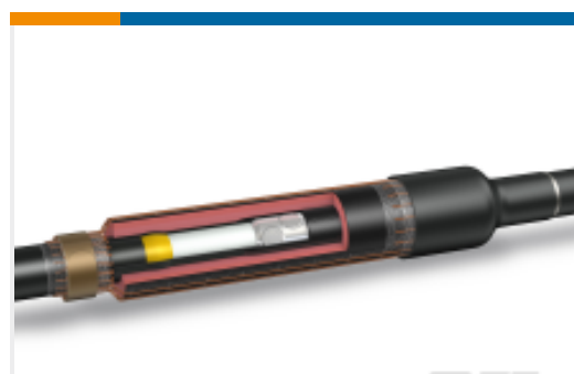
TE 产品编号E67139-069 POLJ-24/1X120-240