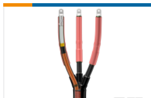
TE 产品编号E92435-063 POLT-12D/3XIH1