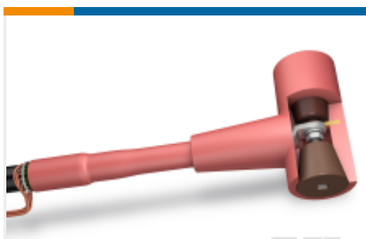
TE 产品编号555340-070 RICS-5123