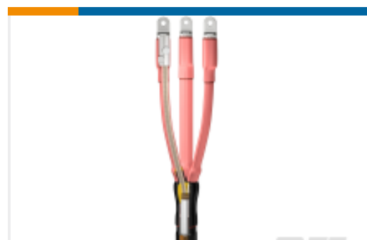
TE 产品编号A31452-070 GUST-12/70-120/800-L12