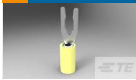
TE 产品编号52430-3 TERMINAL,PIDG SPR SPD 12-10 6