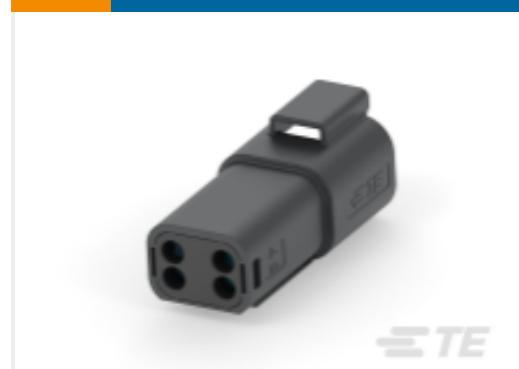
TE 产品编号1-2600030-0 4CCT BLACK RECEP W/LARGE SEAL