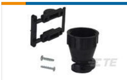
TE 产品编号206070-8 CABLE CLAMP KIT #17