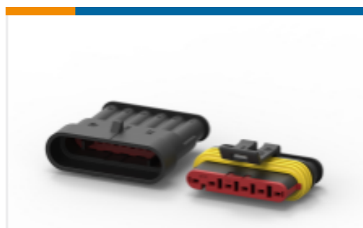
TE 产品编号282104-1 AMP SUPERSEAL 1.5MM, 连接器壳体