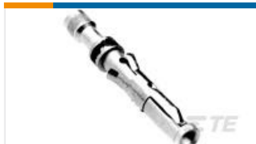
TE 产品编号201328-1 CONTACT SOCKET ASSY.