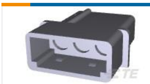
TE 产品编号1-480305-0 03P CMNL CAP HSG F/H NATL