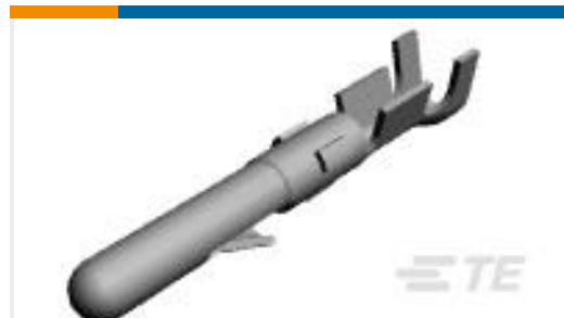
TE 产品编号60620-4 CMNL PIN 20-14 TPPHBZ L/P