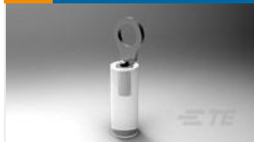
TE 产品编号329636 TERMINAL,PIDG R 24-20 2