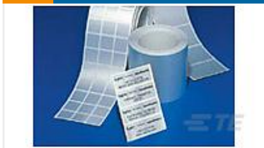
TE 产品编号E44791-000 MP-762508-2.5-8A