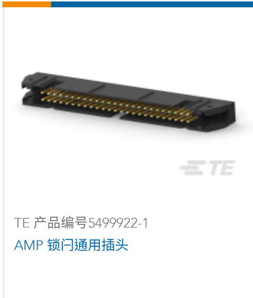
TE 产品编号5499922-1 AMP 锁门通用插头