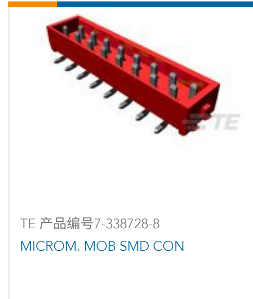
TE 产品编号7-338728-8 MICROM. MOB SMD CON