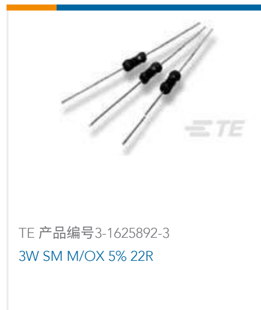
TE 产品编号3-1625892-3 3W SM M/OX 5% 22R