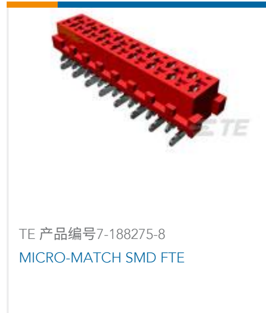
TE 产品编号7-188275-8 MICRO-MATCH SMD FTE