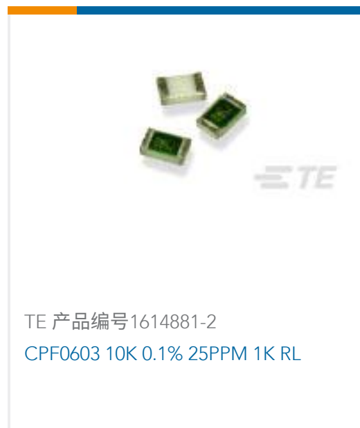
TE 产品编号1614881-2 CPF0603 10K 0.1% 25PPM 1K RL