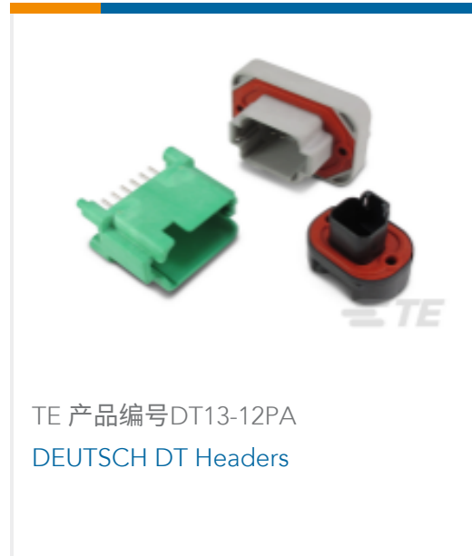
TE 产品编号DT13-12PA DEUTSCH DT Headers