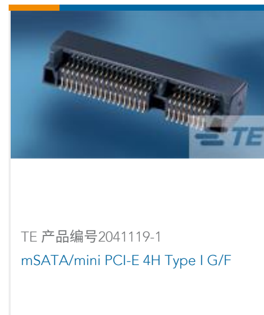
TE 产品编号2041119-1 mSATA/mini PCI-E 4H Type I G/F