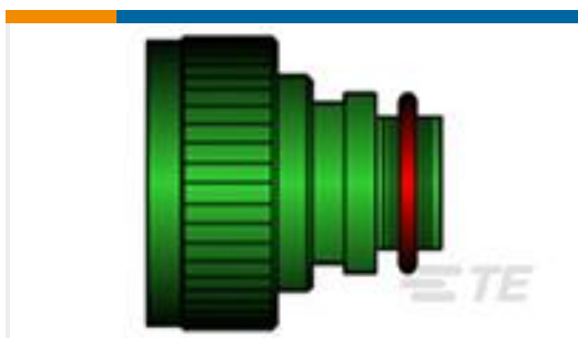
TE 产品编号977403-000 STXR41AB00-1007AI