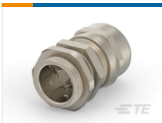
TE 产品编号1478884-3 METRIC EMC GLAND M20X1.5