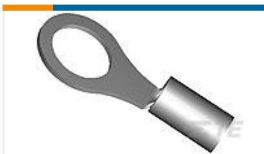
TE 产品编号53041 TERMINAL,T-N R 8 8