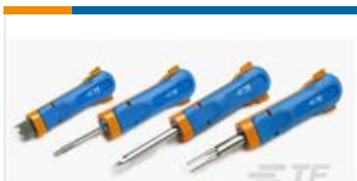
TE 产品编号3-1579007-7 EXTRACTION TOOL