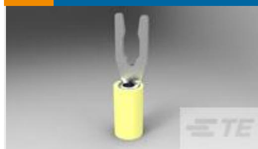
TE 产品编号52430-3 TERMINAL,PIDG SPR SPD 12-10 6