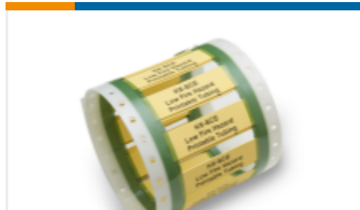
TE 产品编号A69169-000 HX-SCE Low Fire Hazard Sleeves