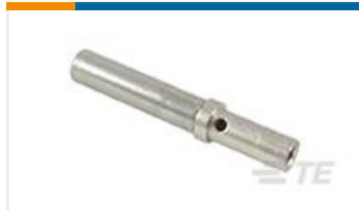
TE 产品编号0462-201-16141 SOC, SOLID, SIZE 16, 16-20AWG, NI