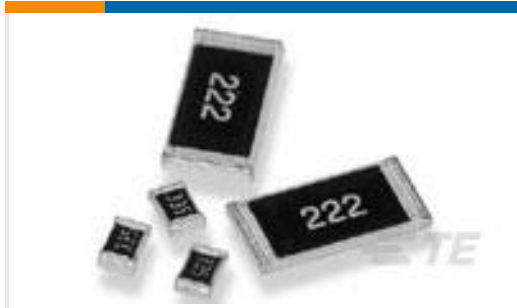
TE 产品编号1622958-1 CRG0603 1% 4K3