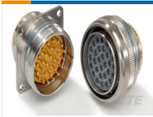
TE 产品编号ZPF000000000035678 983-6R 14-15 S6 L