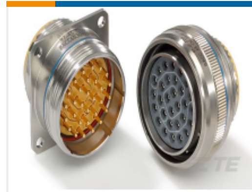
TE 产品编号ZPF000000000009144 983-7SE 18-31 PN