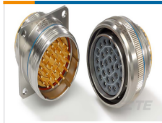
TE 产品编号ZPF000000000008343 983-6R 14-15 SN-L