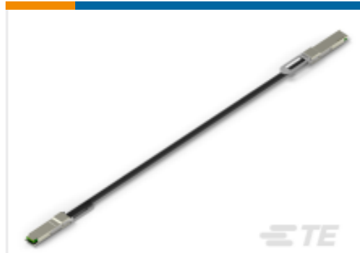
TE 产品编号2333393-7 OSFP 25GIG 30AWG 3 METER