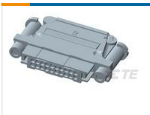
TE 产品编号C87803-000 MTCPQKT1P2SGAA