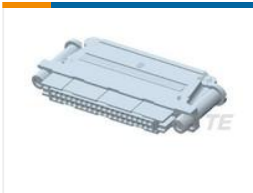
TE 产品编号F79930-000 MTCPQKT2P22SGDD