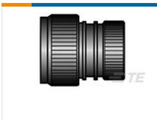
TE 产品编号CJ9705-000 HEX40-AC-00-23-A13-1