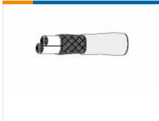
TE 产品编号F371043001 55D1121-22-2/6-9