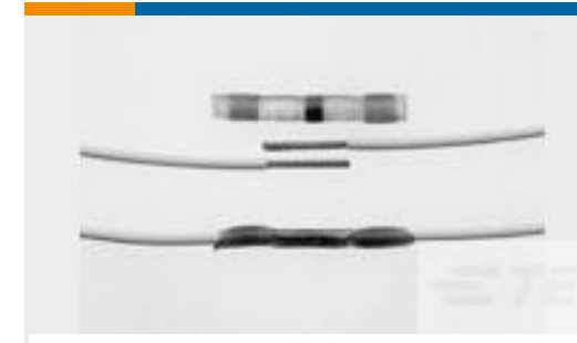
TE 产品编号F80600-000 B-152-9004