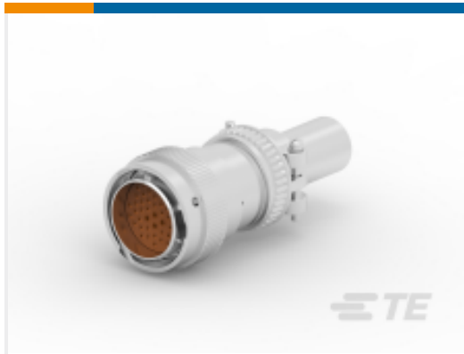
TE 产品编号HD36-24-47PE-059 PLG,47P,AL,E, CBLCLMPBT,DRAIN,16 /20,P,MC