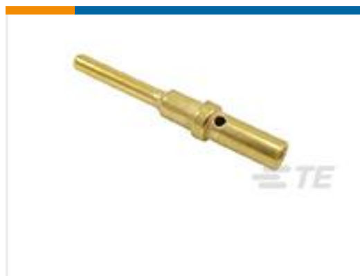
TE 产品编号0460-202-1631 PIN, SOLID, SIZE 16, 16-20AWG, AU