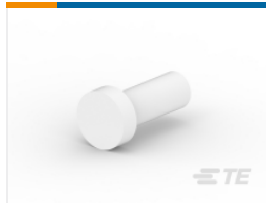
TE 产品编号114018-ZZ SEALING PLUG, SIZE 8, WHT DT