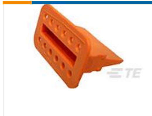
TE 产品编号W12S WEDGE LOCK, 12P, PLG, ORG, STD, DT