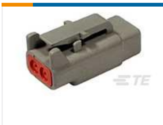
TE 产品编号DTM06-2S PLG, 2P, GRY, N