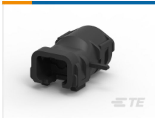
TE 产品编号1011-273-0205 BKSHL, 2P, BLK, PLG, ST, NW 7.5/8.5