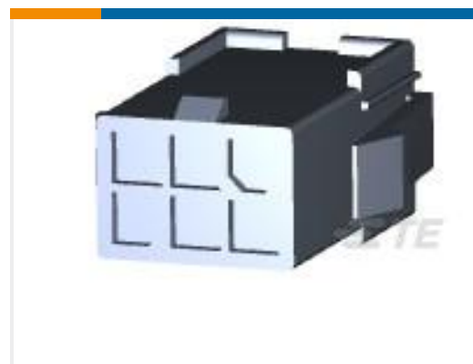
TE 产品编号172160-1 6 CIR UNIV M-N-L CAP