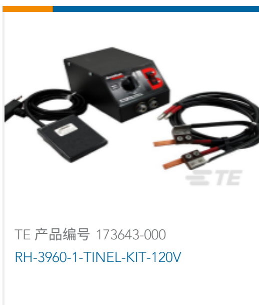
TE 产品编号 173643-000 RH-3960-1-TINEL-KIT-120V