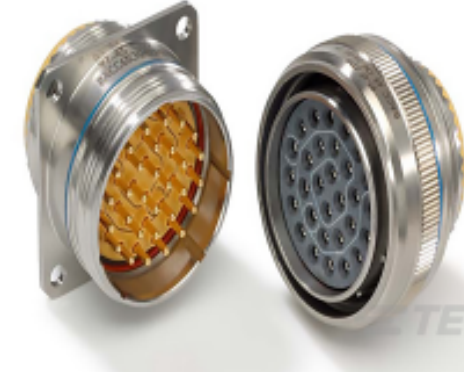
TE 产品编号ZPF000000000136920 983-15 SE 7-12-12 PN-L