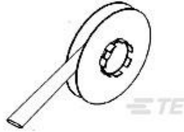
TE 产品编号826415-000 TTMS-12.7-9