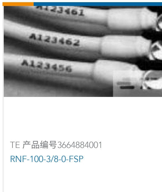
TE 产品编号3664884001 RNF-100-3/8-0-FSP