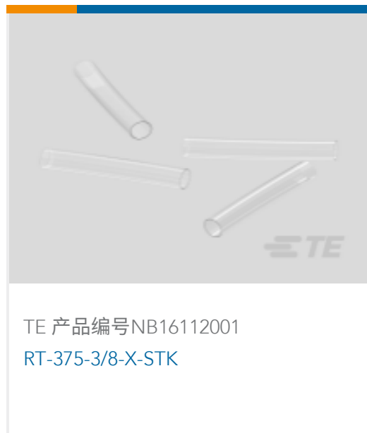
TE 产品编号NB16112001 RT-375-3/8-X-STK