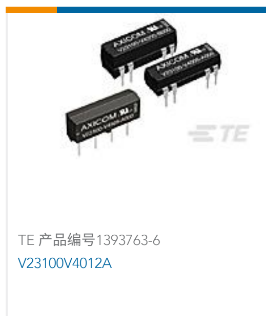
TE 产品编号1393763-6 V23100V4012A