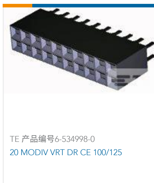
TE 产品编号6-534998-0 20 MODIV VRT DR CE 100/125