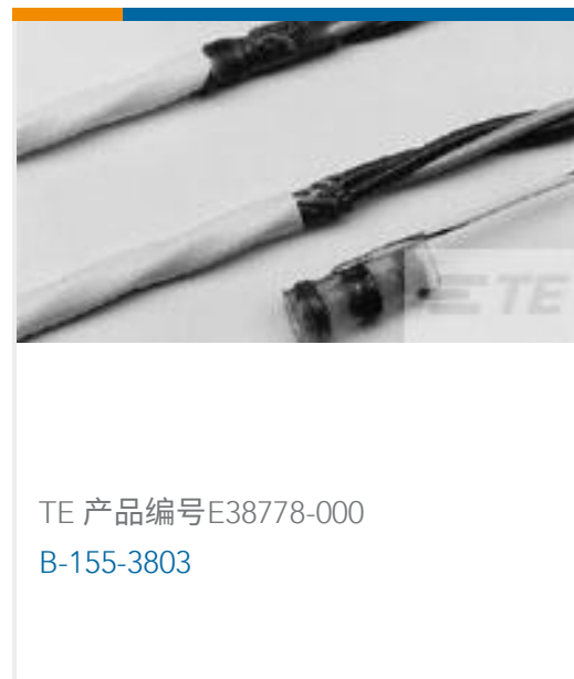
TE 产品编号E38778-000 B-155-3803