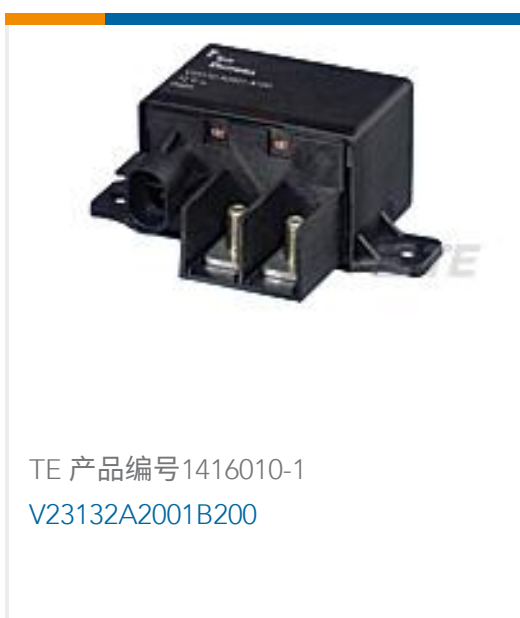
TE 产品编号1416010-1 V23132A2001B200