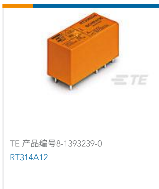
TE 产品编号8-1393239-0 RT314A12