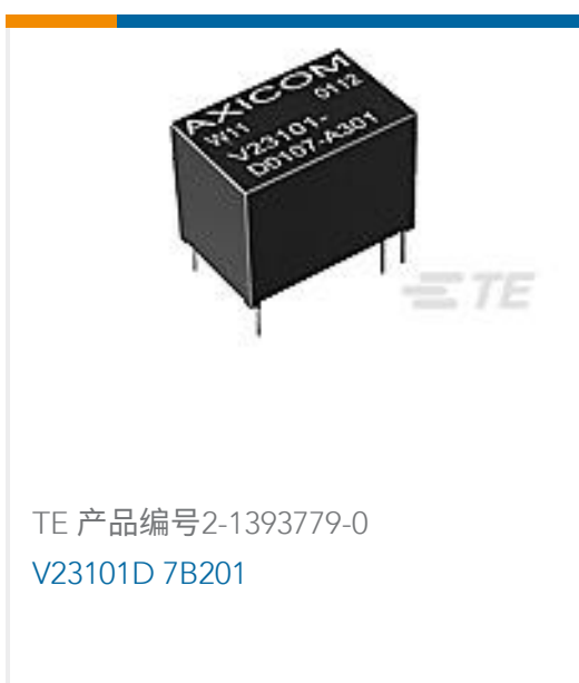
TE 产品编号2-1393779-0 V23101D 7B201