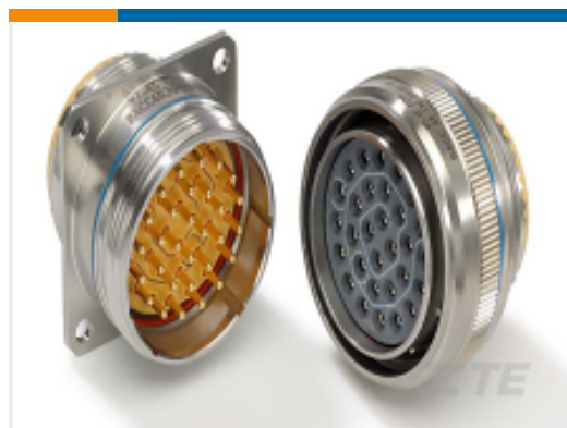
TE 产品编号ZPF0000000000039867 983-7SE 24-61 SN-L