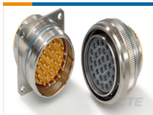
TE 产品编号ZPF0000000000039860 983-7SE 24-61 S6 L