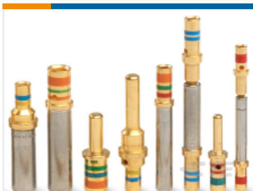
TE 产品编号ZPF000000000003647 724-8021-12