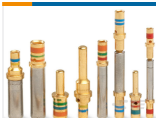
TE 产品编号ZPF000000000001190 097-0004-16