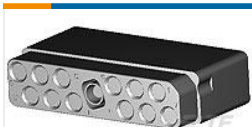
TE 产品编号1-1604800-1 Rect. Quadrax, 12 Pos. Plug, w/ jackscw