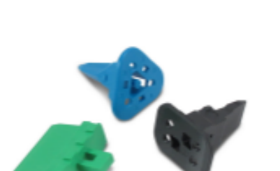
TE 产品编号W2S Wedgelocks: DEUTSCH DT