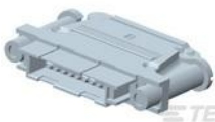
TE 产品编号 C22084-000 MTCPOKT1P2PGAC