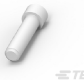
TE 产品编号114017-ZZ SEALING PLUG, SIZE 12/16, WHT