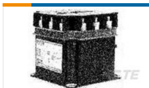
TE 产品编号1616510-1 B140AL=RELAY