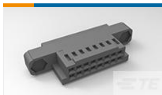
TE 产品编号2-88637-6 044 HOUSING FFC RCPT DR 100CL