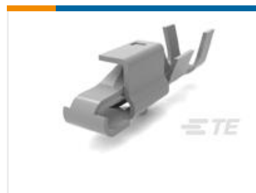
TE 产品编号770476-2 SL156 RECPT, AUNI/PHBZ