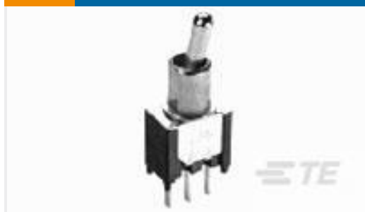
TE 产品编号6-1437561-1 TT11EGRA1=TINY TOGGLE