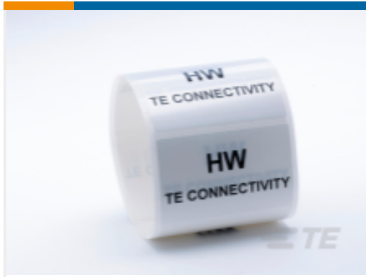
TE 产品编号F67507-000 HW High Tack White Polyester Labels