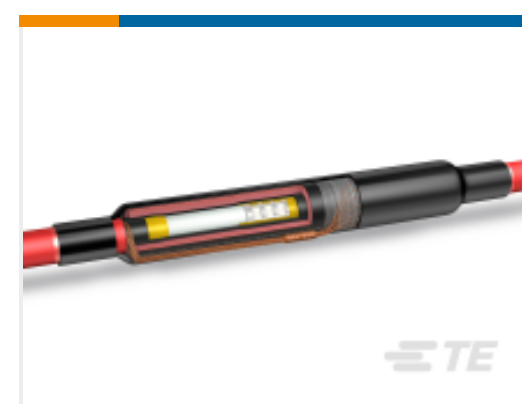
TE 产品编号744973-005 SXSU-3131