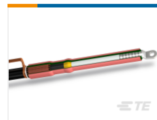
TE 产品编号565915-005 Heat Shrink Terminations: 1C/3C, Indoor