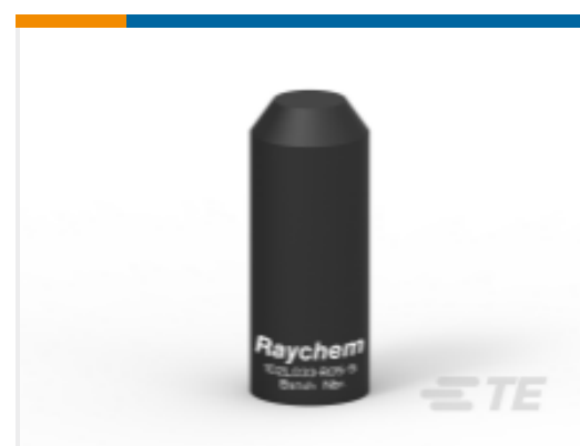
TE 产品编号286711N002 102L048-R05/S(S25)