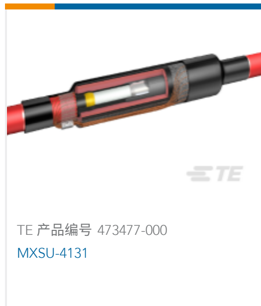
TE 产品编号 473477-000 MXSU-4131