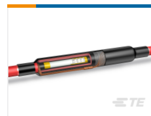
TE 产品编号525605-011 SXSU-5151