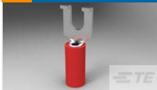
TE 产品编号2-32561-1 PIDG SPDFLG 22-16COMM22-18MIL6