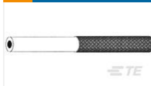
TE 产品编号F833213001 RAY-103-4.0(100)