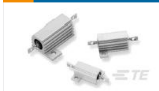
TE 产品编号1879071-9 THS50 R50 5%