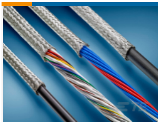
TE 产品编号CQ50573001 RAY-103-7.5(10)