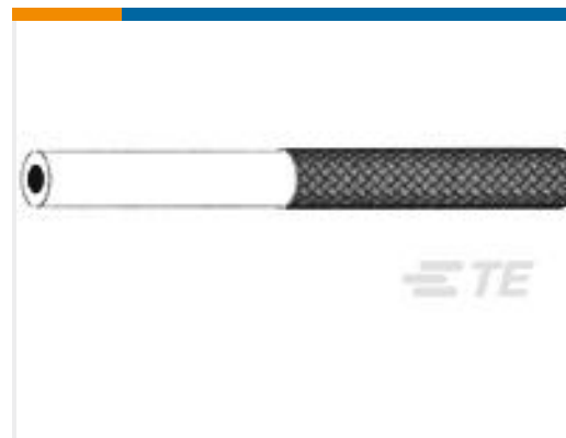
TE 产品编号1384453002 RAY-103-20.0(50)