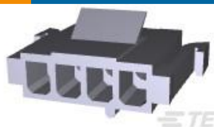
TE 产品编号1-480425-0 04P CMNL PLUG HSG P/M NATL