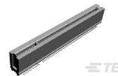
TE 产品编号5145098-1 CONNECTOR ASSEMBLY, DUAL POSIT