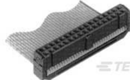
TE 产品编号1-1658622-0 50 NOVO MIL/CTR 30DP, LEAD FREE