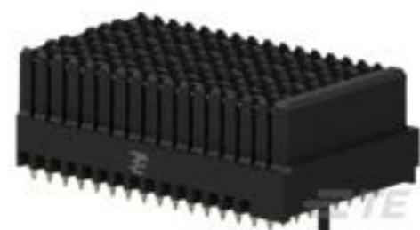
TE 产品编号2102737-1 BP, Right End, MULTIGIG RT 2R