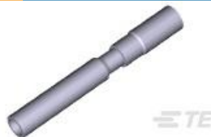
TE 产品编号193842-1 SKT ASSY., 2MM, 12-14 AWG