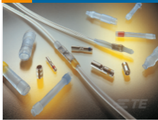
TE 产品编号970433-000 D-106-6025CS1241