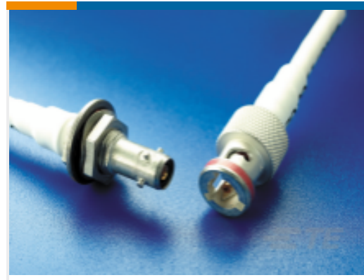
TE 产品编号613049-000 D-621-0436