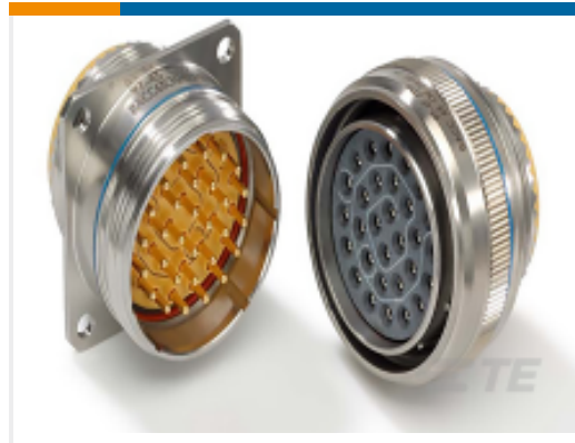
TE 产品编号ZPF000000000007718 983-0SE 24-30 S7 L