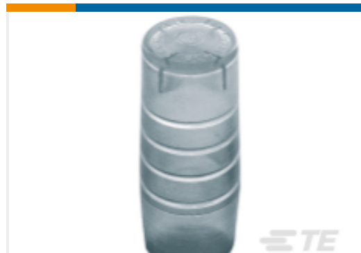
TE 产品编号CN1960-000 GURO-CEC-8/12