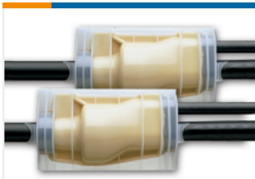
TE 产品编号C57047-000 RAPID-43B-D170