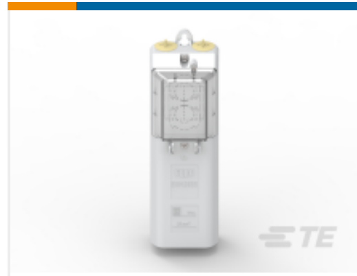
TE 产品编号A27844-000 EKM-2035-2D2