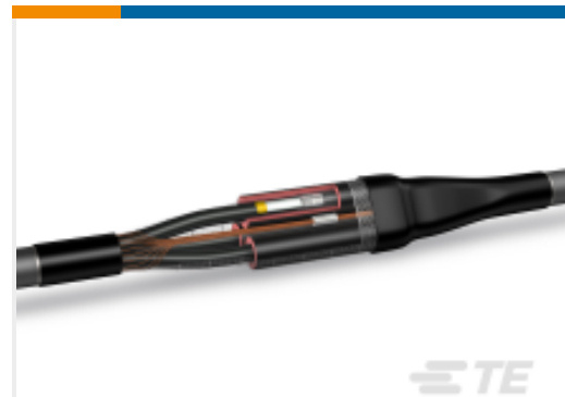
TE 产品编号D11309-015 POLJ-12/3X25-70