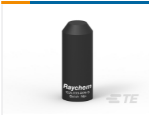
TE 产品编号252509N002 102L066-R05/S(S10)