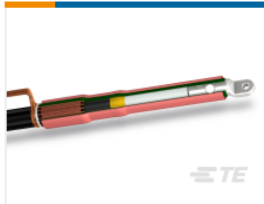
TE 产品编号A00805-014 POLT-12D/1XI