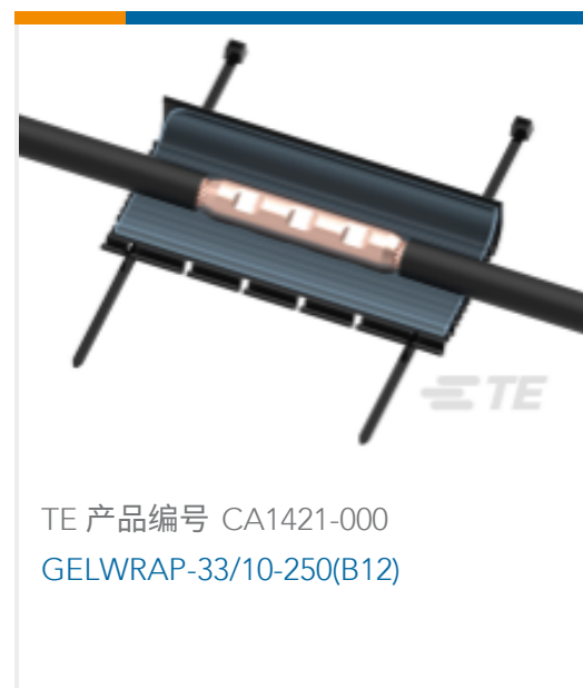
TE 产品编号 CA1421-000 GELWRAP-33/10-250(B12)