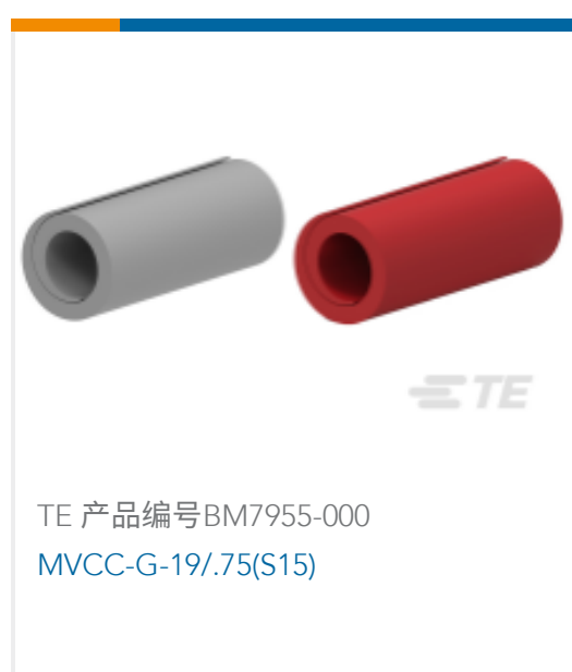
TE 产品编号 BM7955-000 MVCC-G-19/75(S15)