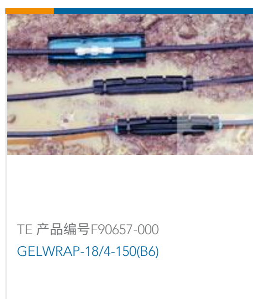
TE 产品编号 F90657-000 GELWRAP-18/4-150(B6)