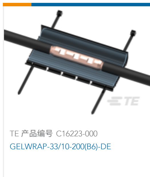
TE 产品编号 C16223-000 GELWRAP-33/10-200(B6)-DE