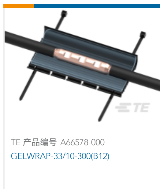
TE 产品编号 A66578-000 GELWRAP-33/10-300(B12)