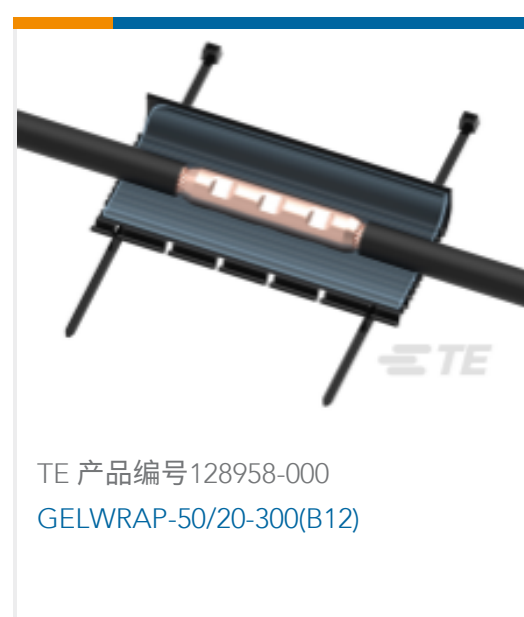
TE 产品编号 128958-000 GELWRAP-50/20-300(B12)