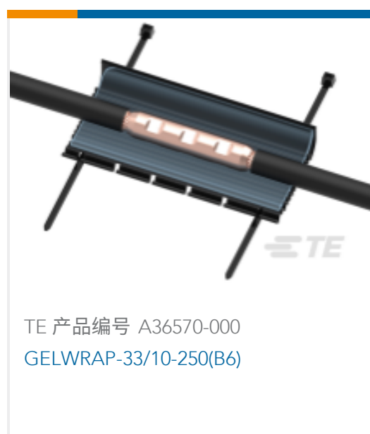
TE 产品编号 A36570-000 GELWRAP-33/10-250(B6)