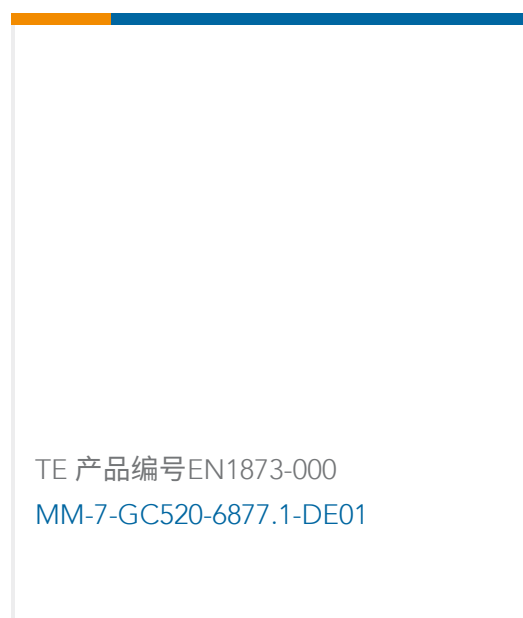
TE 产品编号 EN1873-000 MM-7-GC520-6877.1-DE01