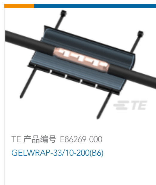
TE 产品编号 E86269-000 GELWRAP-33/10-200(B6)