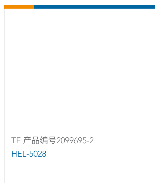
TE 产品编号 2099695-2 HEL-5028