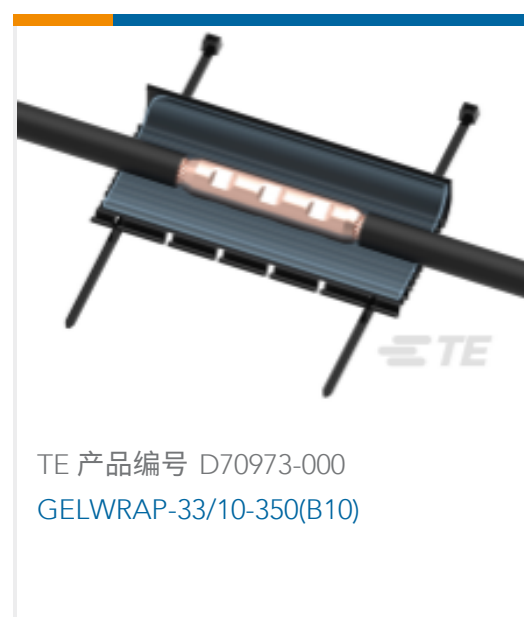
TE 产品编号 D70973-000 GELWRAP-33/10-350(B10)