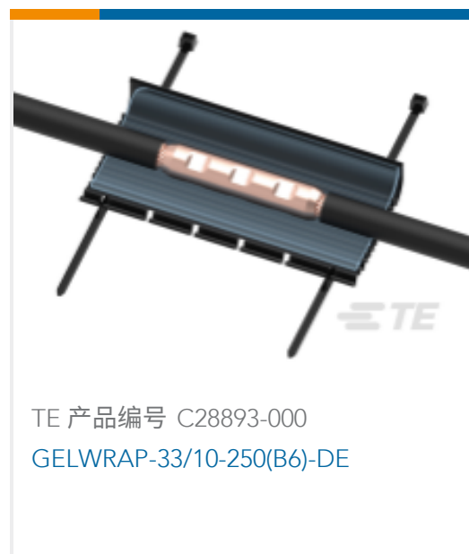
TE 产品编号 C28893-000 GELWRAP-33/10-250(B6)-DE