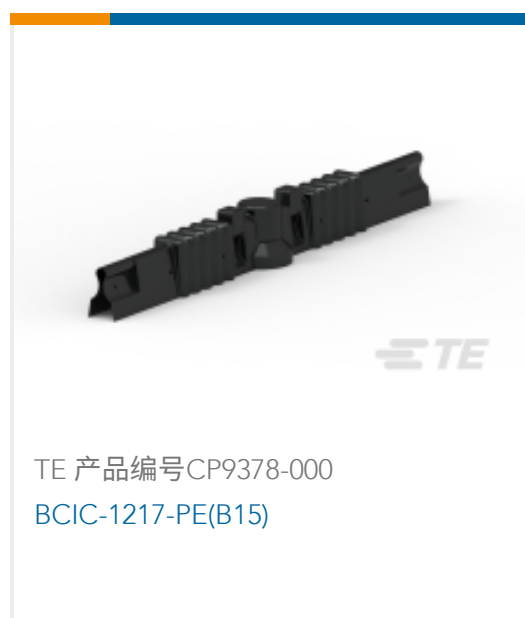
TE 产品编号 CP9378-000 BCIC-1217-PE(B15)