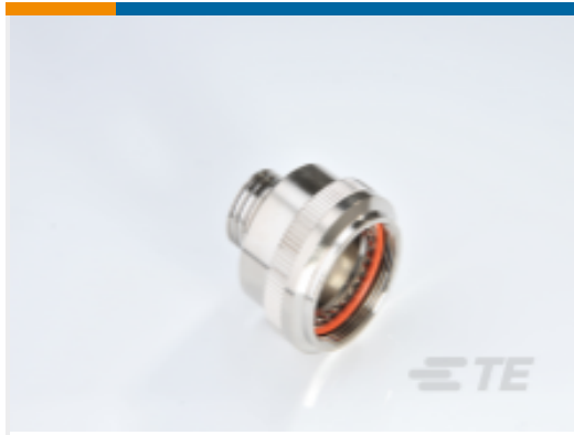
TE 产品编号70A1-20-16-1-B 70A1-20-16-1-B