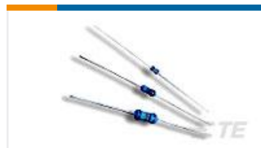
TE 产品编号2-1879026-6 YR1 0.1% 17R8