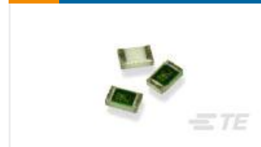
TE 产品编号9-1879221-7 CPF 0603 16R9 0.1% 25PPM 1K RL