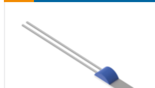
TE 产品编号NB-PTCO-192 Pt1000, 1.2x4.0, Class A, PTFM102A1A0