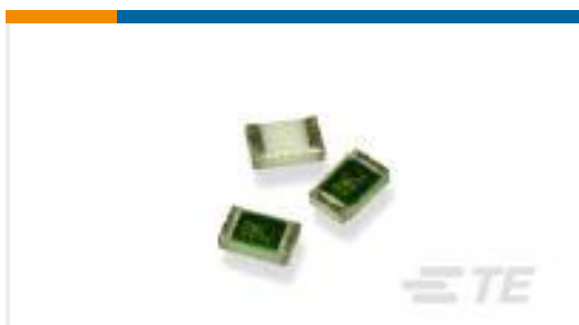
TE 产品编号1-1879222-7 CPF 0603 28R 0.1% 25PPM 1K RL