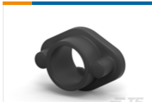
TE 产品编号2289235-1 DTSKF-1, DTSK FLANGE MOUNT