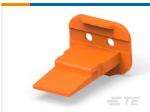
TE 产品编号W2S-P070-Y SEAL RETN WEDGE. ORANGE DT 2 W