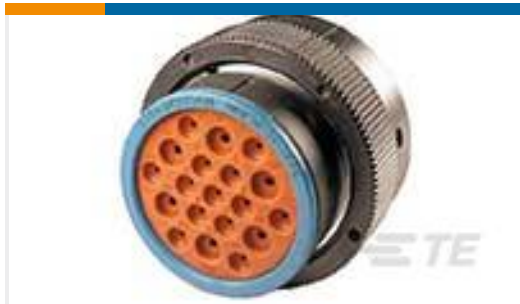
TE 产品编号HDP26-24-19PE PLG, 19P, BLK, E, 12/16, P