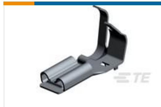
TE 产品编号2232342-1 187 PL EX FLAG REC. 22-16AWG PTBR