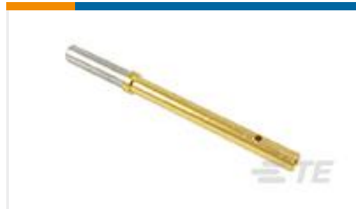
TE 产品编号0462-221-1631 SOC, SOLID, SIZE 16, 16-20AWG, EXT, AU