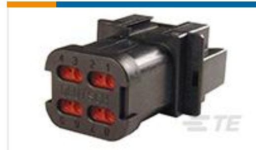
TE 产品编号DT04-08PB-CE01 REC, 8P, BLK, E, CAP, B