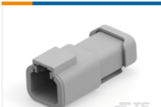
TE 产品编号DTP04-2P-CE01 REC, 2P, GRY, E, CAP