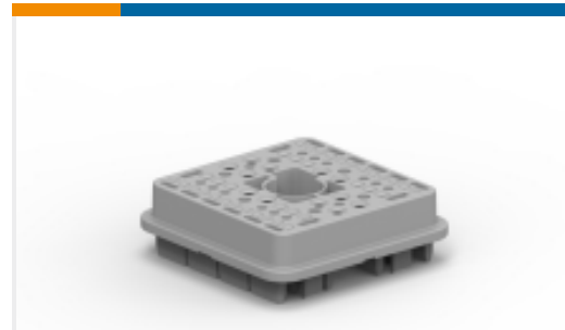
TE 产品编号WB-48SA WEDGE LOCK, 48P, PLG, GRY, DRB, A