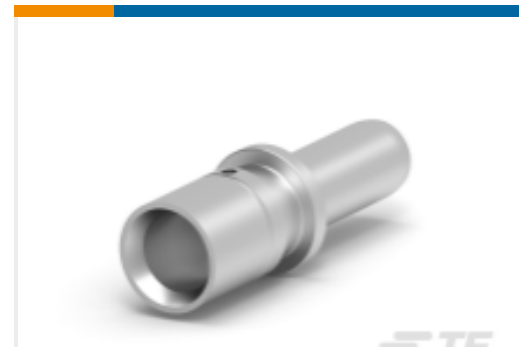
TE 产品编号SRK-PC-080-32-601 PIN, SOLID, SIZE M8, 32mm2, AG