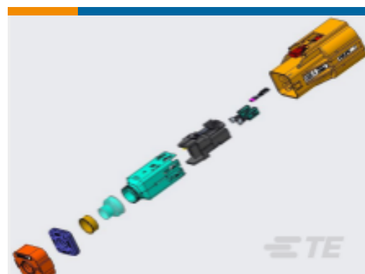
TE 产品编号YHVA630-2PHM-4MM-A HVA630-2phm,4sqmm,Key A