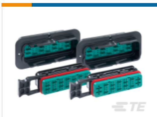
TE 产品编号2500005-1 SRC Pwr 60+6AG Female Recp Hsg Assy