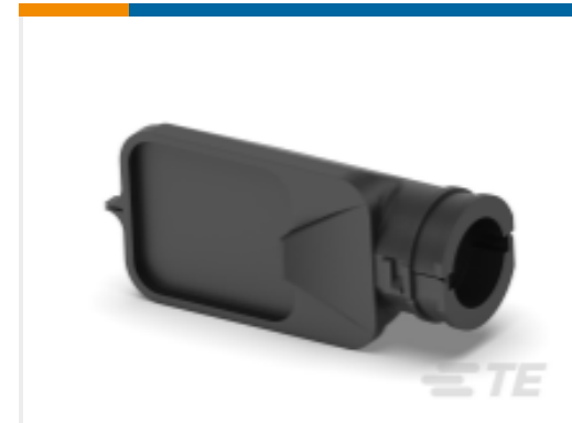
TE 产品编号SRK-BS-FL-90-001 BKSHL, FULL, BLK, RA, NW 22/26