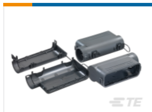
TE 产品编号2500033-1 SRC Power Blind Cavity Plug