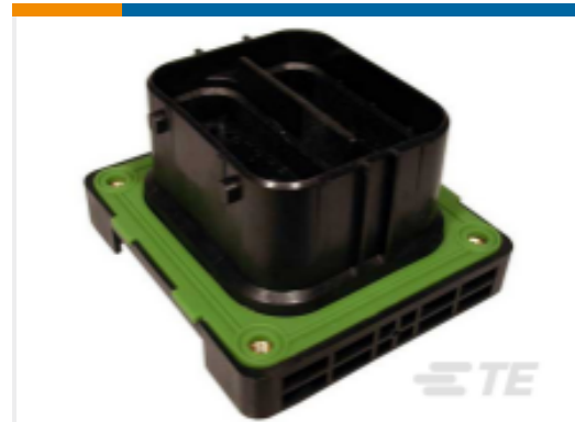
TE 产品编号SRK02-FLA-64A-001 REC, 64P, BLK, E, FLANGE, A