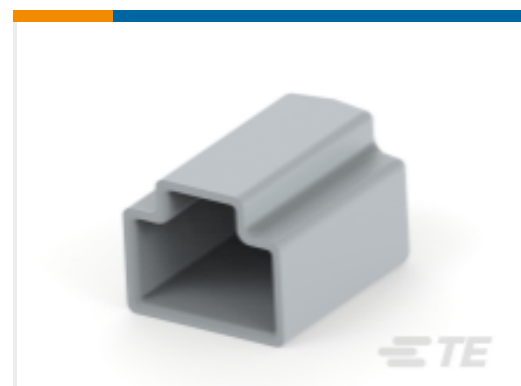
TE 产品编号DTM3S-DC PROTECT CVR, 3P, PLG, GRY, DTM