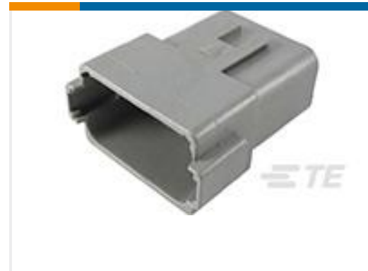
TE 产品编号DT04-12PA-C015 REC, 12P, GRY, E, A