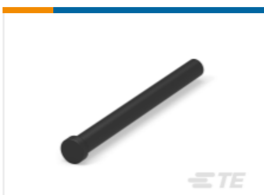
TE 产品编号2236369-1 61103 DVI LOCKING SEALING PLUG #16