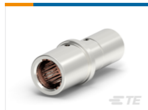
TE 产品编号SRK-SC-080-25-601 SOC, SOLID, SIZE M8, 25mm2, AG