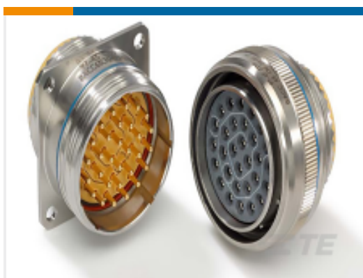
TE 产品编号ZPF000000000141045 983-6S 08-06 SN