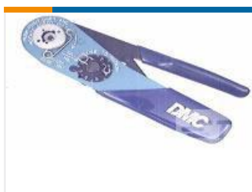
TE 产品编号 601966-1 CRIMPING TOOL M22520/2-01