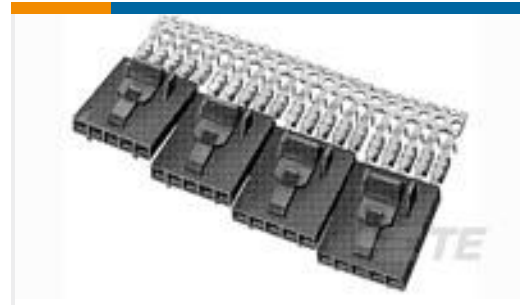
TE 产品编号5-103958-7 2X8 MTE RCPT SR LATCH .100CL