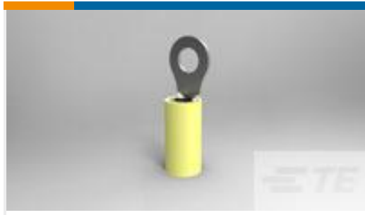
TE 产品编号35109 TERMINAL,PIDG R 12-10 10