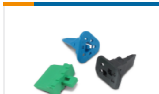
TE 产品编号W2S Wedgelocks: DEUTSCH DT