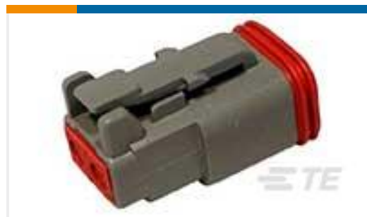
TE 产品编号DT06-2S PLG, 2P, GRY, N