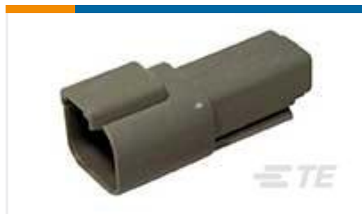
TE 产品编号DT04-2P REC, 2P, GRY, N