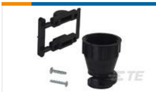
TE 产品编号206070-8 CABLE CLAMP KIT #17