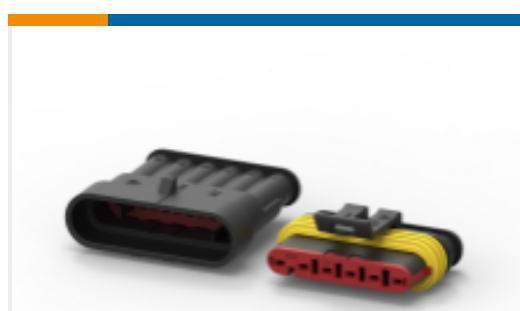
TE 产品编号282104-1 AMP SUPERSEAL 1.5MM, 连接器壳体