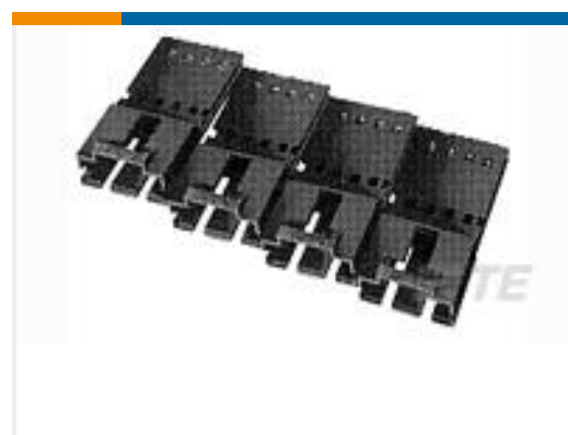
TE 产品编号1-103653-1 12 MTE SHRD PIN HSG SR LATCH