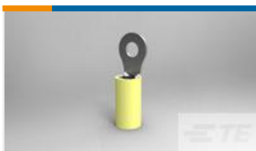
TE 产品编号 2-320568-2 TERM, RT, PIDG IR, 12, #8