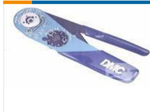
TE 产品编号 601966-1 CRIMPING TOOL M22520/2-01