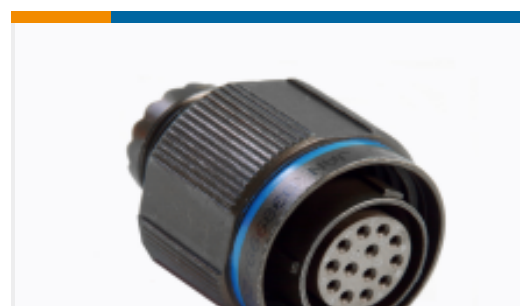
TE 产品编号 DTS26W19-35PN D38999: 直式插头, 19-35 插件