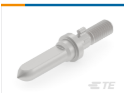
TE 产品编号1-2000676-8 Keyed Guide Pin, Machined