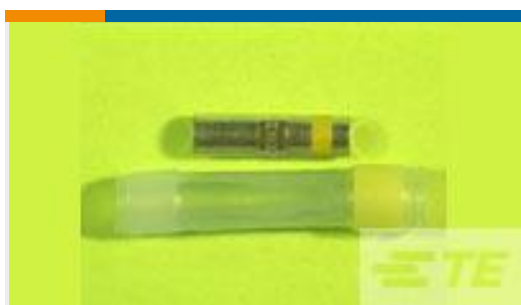
TE 产品编号650075-000 D-436-37