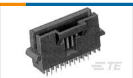
TE 产品编号104071-2 05 SYSTEM 50 HDR SRST SHRD