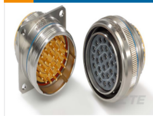
TE 产品编号ZPF000000000007856 983-0YE 12-03 PN