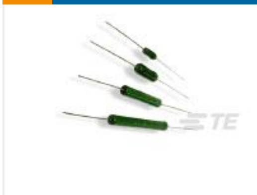
TE 产品编号1-1623774-5 C14 10K 5% (LOOSE)