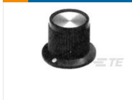
TE 产品编号1437624-6 PK50B1/4=KNOB PLASTIC BLK 1/4