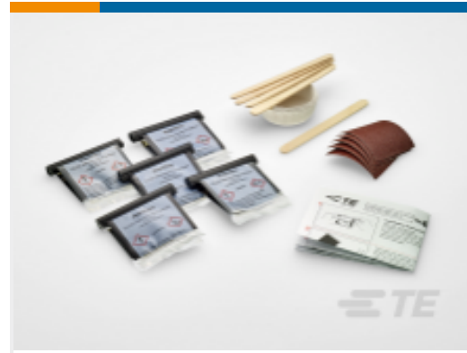
TE 产品编号878462-000 S1125-KIT-1