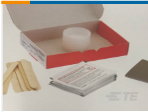
TE 产品编号890036-000 S1009-KIT-A