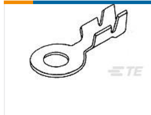
TE 产品编号42547-2 RING 26-22 AWG TPBR