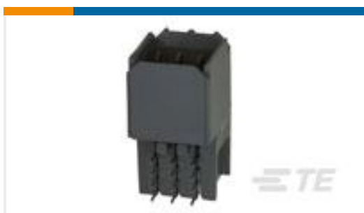
TE 产品编号5-5223961-1 TE UPM R/A Header 3P HC Power, LLL