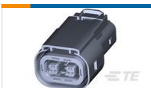
TE 产品编号4-2103177-1 PLUG ASSY, KEY A, FA,CPA, HVA280-2PHI XE