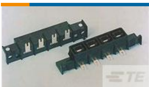
TE 产品编号556882-2 RCPT ASY,R/A,AMPINRGY WTB,2POS