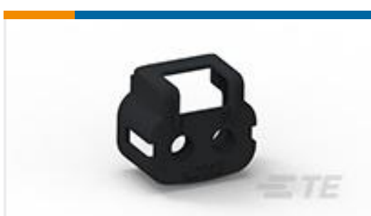
TE 产品编号2103181-3 CABLE SEAL RTNR, SIZE C, HVA280-2PI XE