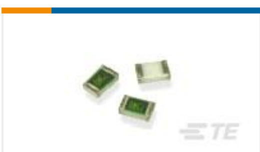
TE 产品编号6-1625867-0 RP 1J 0.166W 25R5 0.1% 25PPM 1K RL